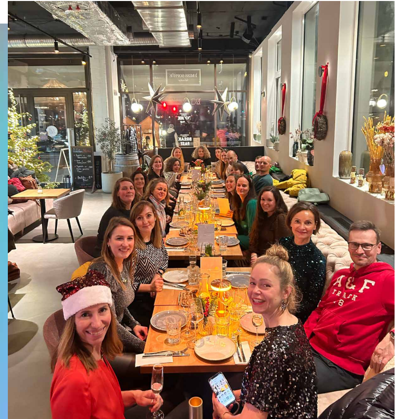
Festtagsstimmung im Büro: Unsere Weihnachtsfeier war ein krönender Abschluss des Jahres.

Wir haben null Toleranz gegenüber Belästigung, sexuellen Übergriffen und Mobbing jeglicher Art. Wir stehen hinter den international anerkannten Menschenrechten und setzen uns für ihre Einhaltung ein. Natürlich verurteilen wir Zwangs- und Kinderarbeit auf das Schärfste und erwarten auch von unseren Geschäftspartnern, dass diese sich klar davon distanzieren.